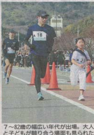
7〜82歳の幅広い年代が出場。大人と子どもが競り合う場面も見られた

瀬戸内リレーマラソン in 大竹の記事 「中国新聞」地域 広島都市圏 2024年1月8日付