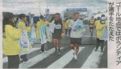
ゴール地点ではボランティア選手をたえた