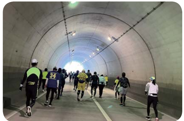
三重松坂マラソン・トンネルのプロジェクションマッピング