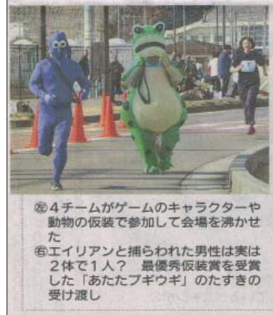
④4チームがゲームのキャラクターや動物の仮装で参加して会場を沸かせた ⑤エイリアンと捕らわれた男性は実は2体で1人? 最優秀仮装賞を受賞した「あたたプキウギ」のたすき受け渡し