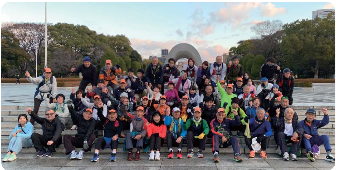
2024年(令和6年)1月1日 元旦マラソン・平和公園にて参加者集合

各地の色々なマラソン大会が復活してきていることは喜ばしいことです。皆さんとも情報交換しながら、今年も各地のマラソン大会を楽しみたいですね。やはり大会があることで練習にも励みに