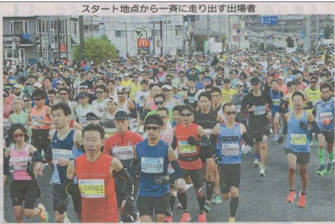
スタート地点から一斉に走り出す出場者

松江市中心部を舞台にしたフルマラソン「国宝松江城マラソン」で、約3300人のランナーが寒風の中を走った。出場者は自己記録の更新や完走を目指し、それぞれ熱い走りを見せた。