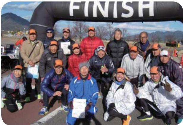
瀬戸内リレーマラソン in 大竹に参加者の皆さん

走ろう会の規約に「この会は、走ることによる体力づくり、健康の維持増進及び会員の親睦をはかることを目的とする。」とありますが、まさにこの目的に沿って今年も会の運営をしたいと思います。会員の皆さんと一緒にそれぞれのペースで楽しく走ったり歩いたりする会にしていましよう。今年もどうぞよろしくお祈りします。