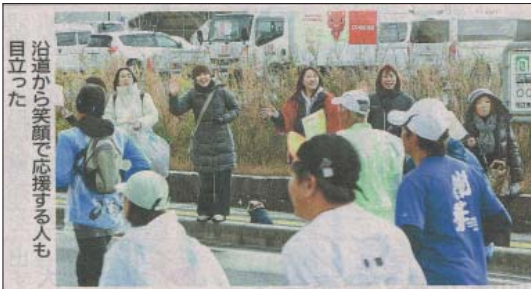
沿道から笑顔で応援する人も目立った