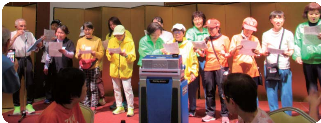
ハーモニカ演奏「お座敷小唄」の替え歌、「ボケません小唄」を 6 番まで合唱

帰りの車内はカラオケを歌いながら、和気あいあいで帰路に就く。金井支部長・森野幹事長始め参加された皆さん、ありがとうございました。後日、妻・孝子 (77) に大会本部から「20 位の飛び賞」奈良漬けが届いた。想定外の妻の笑顔が待っていたとは？大仏様に一礼一拍一拝一礼！