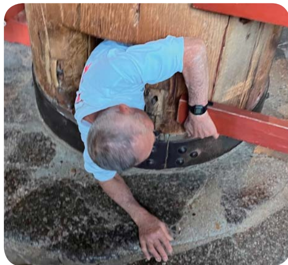
大仏様裏手に柱の穴潜り柱穴潜り挑戦

大仏様は中学の修学旅行以来66年振りの再会！大仏様の裏手に柱の穴潜りがあり、私だけが