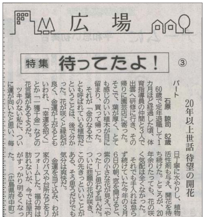
No. 159 石原諒司さんの記事