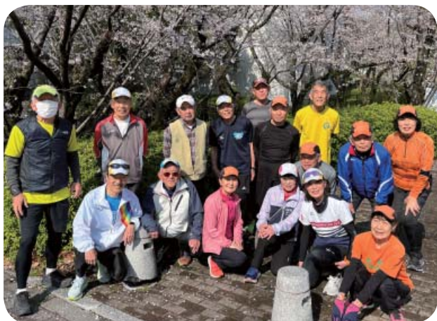
【広島マラニック倶楽部】