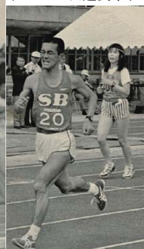
⑤週刊文春(昭和61年3月27日発行)